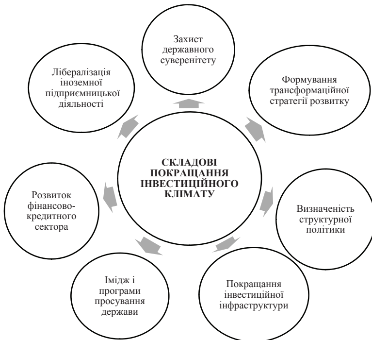
Рис. 2. Складові покращання інвестиційного клімату в Україні