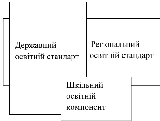
Рис. 2. Структура змісту освіти

Шкільний компонент змісту навчання передбачає адаптацію державного стандарту базової й повної освіти і стандарту базової й повної освіти регіону до умов реального процесу навчання та можливість подальшого його ускладнення, поглиблення й т. ін. (врахування особистісного запиту), об'єктивує профільну спрямованість розвитку особистості, завершуючи задавати стан та характер (профіль, спрямованість) антропотизованої геосистеми як характер антропологізації.