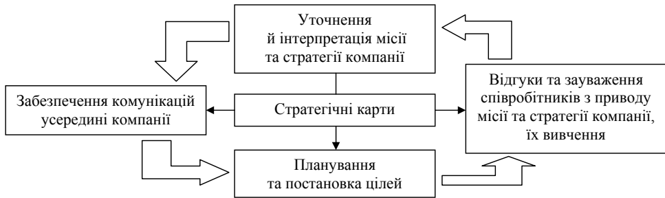
Рис. 1. Характеристика методу стратегічних карт у моделі Каплана й Нортон [3, с. 36]