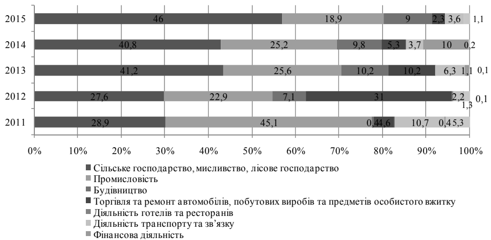
Рис. 2. Структура інвестицій в основний капітал за галузями економіки, % (складено на підставі даних табл. 2)

Структура інвестицій в основний капітал за галузями економіки має такі особливості. У 2010–2016 рр. від 60 до 75% всіх інвестицій припадали на галузі, які виробляють продукцію, в основному промислову та сільське господарство, з 2012 р. почали інвестувати в будівництво.