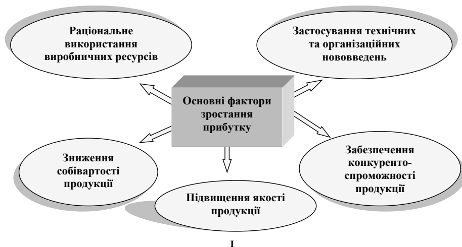
Рис. 1. Основні фактори підвищення прибутку підприємства

Прибуток як джерело виробничого та соціального розвитку є одним з основних факторів у забезпеченні самофінансування підприємства. При цьому можливості підприємства в основному визначаються тим, наскільки його доходи перевищують витрати. Тому важливу роль у діяльності підприємства відіграє не тільки прибуток, але і його збитки. Останні зазвичай можуть вказувати не тільки на прорахунки, а навіть на помилки в організації виробництва і реалізації збуту продукції. Відзначене дозволяє стверджувати, що прибуток є тим результатом діяльності підприємства, який вказує на його абсолютну ефективність. На рис. 1 наведено основні фактори підвищення прибутку підприємства.