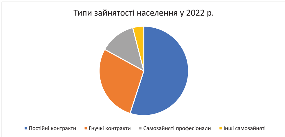
Рис. 2 Розповсюдженість різних договорів праці серед зайнятого населення, %. Складено автором за даними [5]

Також слід додати що нідерландський ринок праці досить нестандартний і має найбільшу кількість тимчасово зайнятих у європейському регіоні. Умови працевлаштування включають три типи трудового договору: постійний, гнучкий або самозайнятий. Згідно з даними DNB, 28% населення працюють за тимчасовим(гнучким) контрактом, а влаштованих на постійні основи лише 55%, ще 13% і 4% становлять незалежні професіонали та інші самозайняті. (Рис. 2).